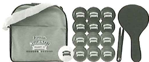
ポッチャボールセット (60 団体:対象は中学生以下)