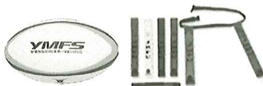
タグラグビーセット (60 団体:対象は小学生以下)